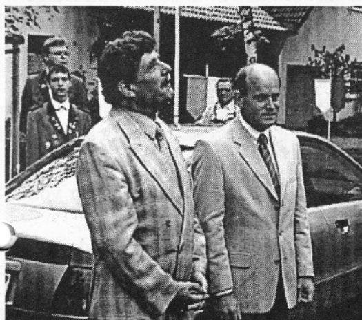
„Zufrieden nach getaner Arbeit“

Da für Straßenamen die Politik zuständig ist, wurde auf Antrag der CDU dies in der Bezirksvertretung einstimmig beschlossen. Eine Argumentation seitens der Politiker war übrigens, daß „Große Teile der Pescher Bürger, der Pfarrgemeinderat sowie die Katholische Kirche dies wünschten“.