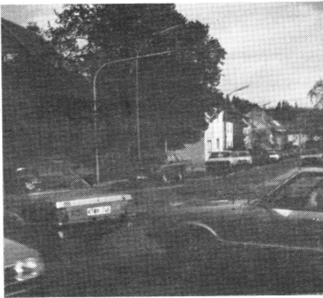
Johannes- / Mengenicher Straße